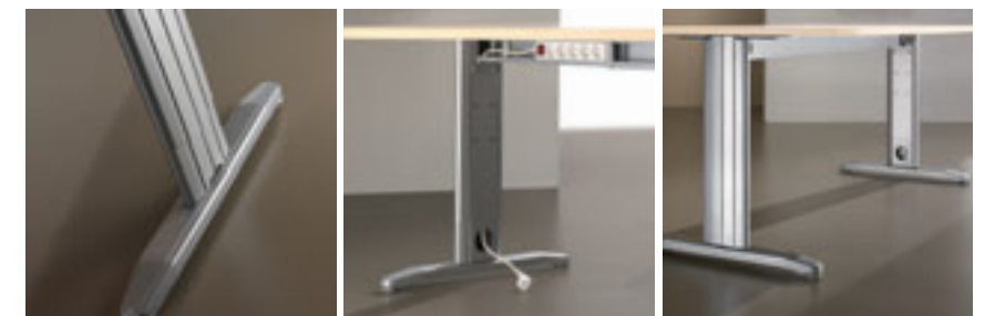
Piétement réglable en hauteur

Une gamme conçue pour le confort des utilisateurs. La gamme Steel 3.0 offre un piétement centré favorisant la circulation entre des postes juxtaposés. Steel 3.0 permet également la gestion des câbles dans la poutre et dans les piétements pour un aménagement plus professionnel.